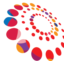
Tercera Reunión de la Conferencia Regional sobre Población y Desarrollo de América Latina y el Caribe

Tanto la Agenda 2030 y sus Objetivos de Desarrollo Sostenible como Programa de Acción de la CIPD después del 2014 parten de la premisa de que el desarrollo económico debe sincronizarse con el desarrollo humano, y con la sostenibilidad del medio ambiente y sus recursos naturales. El Consenso de Montevideo combina el desarrollo económico con el desarrollo humano, los derechos humanos y el respeto del medio ambiente y propone el desarrollo de políticas que respondan a asuntos poblacionales urgentes como la salud sexual y reproductiva; el envejecimiento de la población; la niñez, la adolescencia y la juventud; la igualdad de género, la migración internacional; la desigualdad territorial, la movilidad espacial y la vulnerabilidad; la inclusión igualitaria de los pueblos indígenas y la población afrodescendiente y el combate al racismo y la discriminación racial.